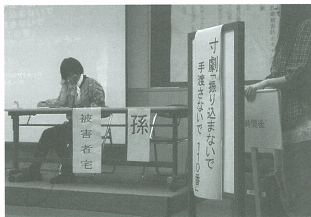
寸劇を行っている様子(10月1日実施)

当初予定していた参加者へのアンケート調査は会場の都合で実施できなかったが、高尾警察署長、生活安全課長、地域自治会関係者の方の話から、①プロの劇団よりも学生の劇団の方が新鮮なイメージがあり、より説得力があった、②教授の講演、生活安全課の講話と寸劇が結びつくことによって振り込め詐欺の実態を理解できた、などの感想が寄せられ、今回のゼミ生による寸劇は成功したものと思う。