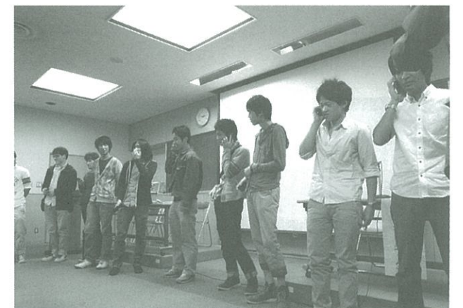
「絆架電作戦」として2年男子が実際に家族に電話をしている様子