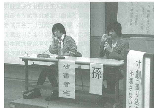
被害者が孫に連絡をとるシーン