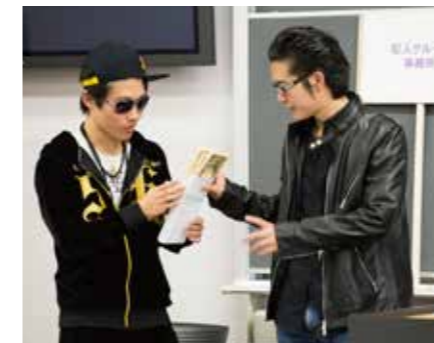
実際の詐欺事件の記録を参考に台本を作成した