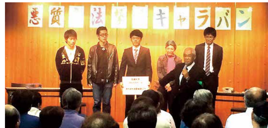
国分寺市Lホールでの寸劇の公演

ことがある」そして49名が、「親戚や知人にオレオレ詐欺の電話がかかってきたことがある」と回答があり、この犯罪との遭遇件数の多さを実感しました。また32名はオレオレ詐欺の対策が不十分であることがわかりました。寸劇の中で紹介する、オレオレ詐欺等警察の相談窓口#9110については、125名の方が「知らない」と回答したので、私たちの寸劇で、防止活動の周知に繋がってもらえればと思います。アンケートの感想では、「寸劇を見ることで実感としてのイメージができた。自分は大丈夫だと思っていたが、だまされてしまうかも?」と思った。」「楽しい寸劇でした。若い私でも、再現がリアルでわかりやすかった