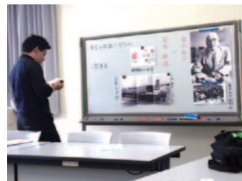
9月19日 C館511 打ち合わせ、撮影風景