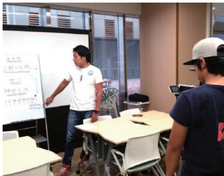
8月9日 自習室での撮影風景

https://www.youtube.com/watch?v=JJKFDJ7SVo&sns=em