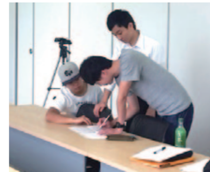
9月6日 会議室 打ち合わせ中の風景