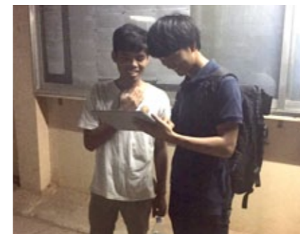
10月上旬 現地の学生に映像を視聴してもらっている様子